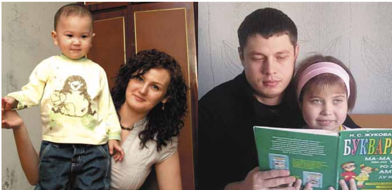
Рис. 5. Родственные доноры и реципиенты: а — наблюдение 1, через 1 год после трансплантации; б — наблюдение 2, через 9 мес после трансплантации

Представленный первый успешный клинический опыт свидетельствует о возможности выполнения трансплантации фрагментов печени от живых родственных доноров и открывает перспективы для радикального лечения пациентов с гликогенозом I типа в нашей стране (рис. 5).