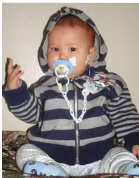
Рис. 1. Пациент с гликогенозом Ib перед операцией: локальные отложения жира, преимущественно на щеках («кукольное» лицо); в связи с тяжелой гипогликемией для частых дневных и ночных кормлений установлен назогастральный зонд

Характеристика клинических наблюдений. В 2 наблюдениях гликогенозов: мальчика 1 года (рис. 1*) и девочки 6 лет, на основании комплексной анамнестической, клинико-лабораторной и инструментальной оценки с последующим молекулярно-генетическим анализом диагностированы гликогеноз Ib типа (наблюдение 1) и гликогеноз Ia типа (наблюдение 2), соответственно (табл. 1, рис. 2). Следует подчеркнуть, что в наблюдении 1 в клинической картине заболевания наряду с синкопальными состояниями, развивающимися на фоне гипогликемии, преобладали инфекционные осложнения, преимущественно в виде инфекций дыхательных путей и гнойничковых поражений кожи. Их развитие было сопряжено с рецидивирующей нейтропенией вплоть до развития агранулоцитоза, что требовало назначения гранулоцитарного колониестимулирующего фактора.