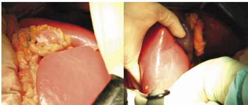
Рис. 3. Гепатомегалия у пациента с гликогенозом Ia (интраоперационные фотографии, наблюдение 2)

В наблюдении 2 посттрансплантационный период на 12-е сутки осложнился развитием несостоятельности билиобилиарного соустья с развитием желчного затека. Пациентке была выполнена релапаротомия с герметизацией области несостоятельности. Вынужденная минимизация режимов иммуносупрессии на фоне холангита стала причиной активации реакции острого клеточного отторжения. Эффективность проводимых лечебных мероприятий по борьбе с инфекционными осложнениями позволила в последующем провести данной пациентке пульс-терапию метилпреднизолоном с одновременной оптимизацией доз базового препарата – такролимуса (Прографа). Криз отторжения был купирован, о чем свидетельствовало улучшение биохимических показателей и морфологической картины биоптата трансплантата. К 7-му месяцу посттрансплантационного периода у пациентки постепенно нарастала клинико-лабораторная и инструментальная картина стриктуры билиобилиарного анастомоза, в связи с чем была успешно выполнена повторная реконструк-